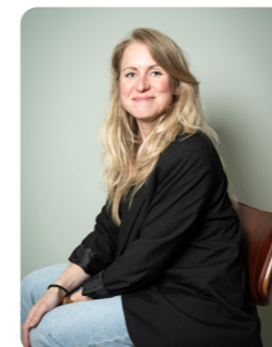
Daisy Ingeveld Coöperatie Primera